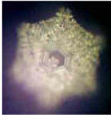
alte, vergessene Heilquelle

Dr. Masaru Emoto zeigt uns einzigartige Fotos von Wasserkristallen. Jede Art von Schwingungen mit guter oder negativer Information wird vom Wasser gespeichert. Dies ist ein Hinweis auf die Beziehung zwischen der Schönheit und Ausprägung der Kristallform und der Wasserqualität. Die Bilder sprechen für sich: